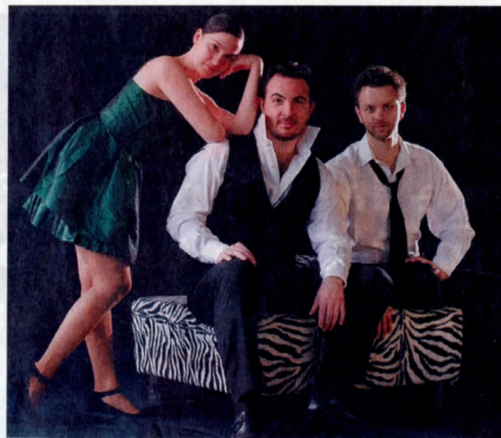
«L'opéra dans tous ses états», ce week-end à Rolle. DR MARC-ALAIN ZIMMERLI

«L'opéra dans tous ses états» Vendredi 20 et samedi 21 janvier à 20h au Casino Théâtre de Rolle. www.comiquopera.ch